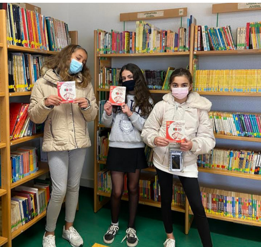
Um momento da entrega de prémios do "Concurso Marcadores de Livros Direitos Humanos"