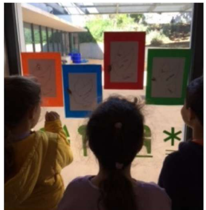
Ler para a Paz e Harmonia Globais 2.º 3.º anos EBSA e EB Afonso do Paço