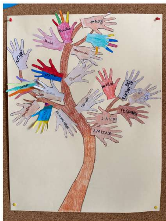
4.º ano EB Afonso do Paço