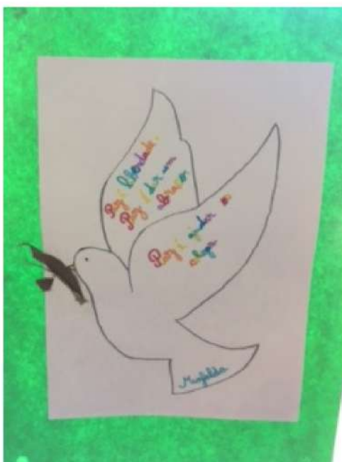
PAZ É... 2.º anos EBSA e EB Afonso do Paço