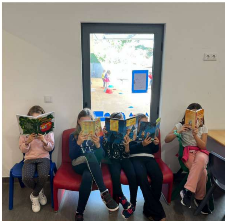
“Uma rapariga com um livro” homenagem a Malala Yousafzai pelas alunas do 1.º ciclo da EBSA