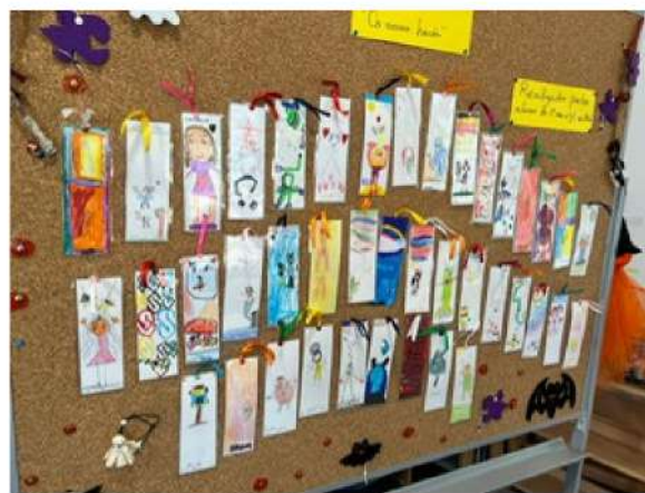
Receção aos novos alunos Exposição de marcadores de livros JI e 1.º ano – EBSA